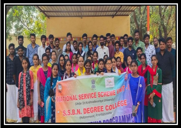
A TEAM OF NSS VOLUNTEERS AFTER SPECIAL CAMP VALEDICTORY FUNCTION ALONG WITH PROGRAMME OFFICER