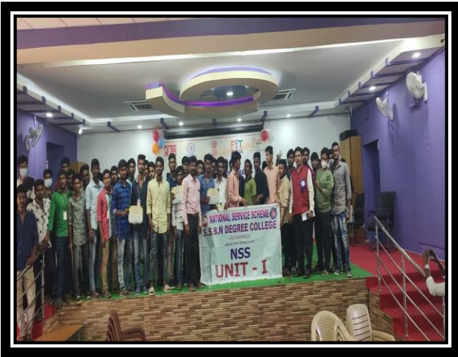
A TEAM OF SSBN BOY VOLUNTEERS ON THE STAG ALONG WITH CERTIFICATES