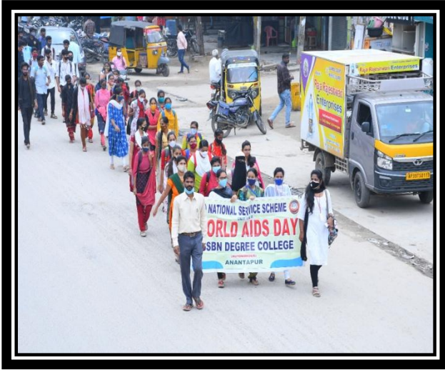
AWARENESS RALLY BY VOLUNTEERS ON HIV/AIDS