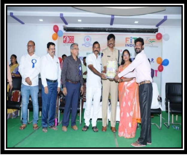
PROGRAMME OFFICER RECEIVING MOMENTO