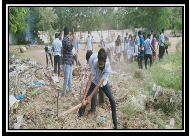
VOLUNTEERS CLEANING GARBAGE ALONG WITH PROGRAMME OFFICER IN THE COLLEGE CAMPUS