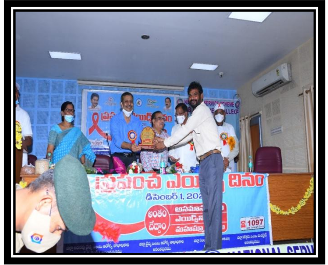
PROGRAMME OFFICER RECEIVING PRIZE WITH DMHO OFFICER, ANANTAPUR