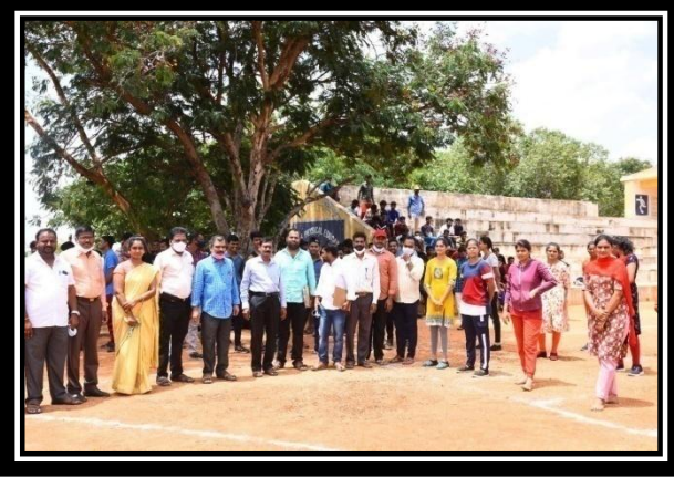
PRE-RD SELECTIONS AT S.K. UNIVERSITY, ATP