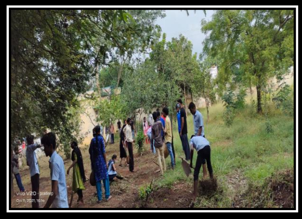
VOLUNTEERS CLEANING THE PREMISES OF COLLECTOR OFFICE