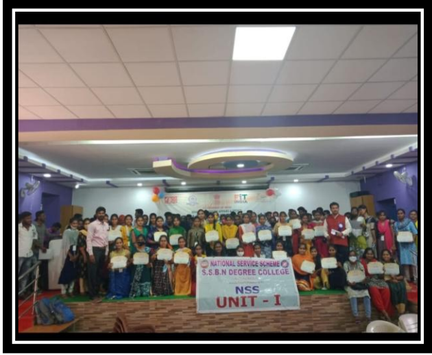
A TEAM OF SSBN GIRL VOLUNTEERS ON THE STAG ALONG WITH CERTIFICATES