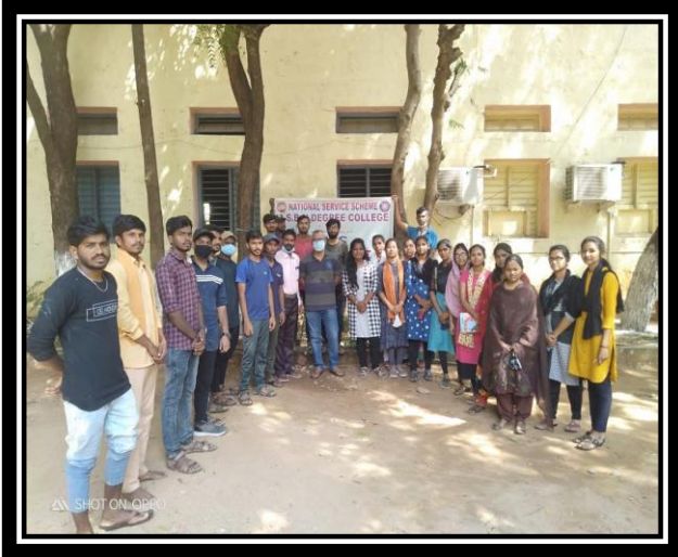
VOLUNTEERS CLEANING PREMISES