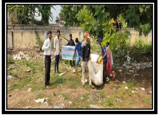
VOLUNTEERS COLLECTING PLASTIC WASTAGE