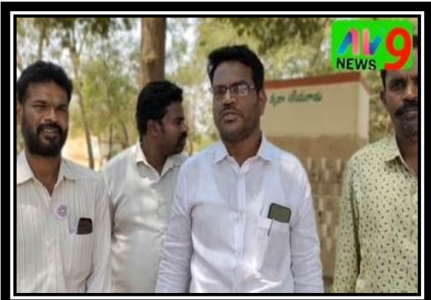
VILLAGE PRESIDENT APPRECIATING THE VOLUNTEERS FOR THEIR WORK IN THE SPECIAL CAMP