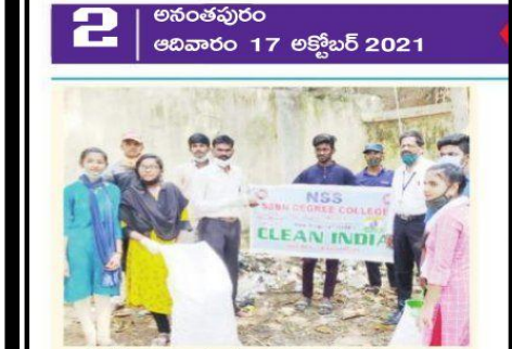
ప్లాస్టిక్ కవర్లు, బాటిళ్లు సేకరిస్తున్న ఎన్ఎస్ఎస్ విద్యార్థులు