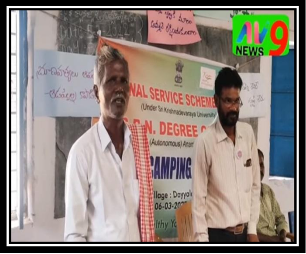
VILLAGER APPRECIATING THE VOLUNTEERS FOR THEIR WORK IN THE SPECIAL CAMP