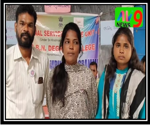
VOLUNTEERS SPEAKING TO THE AV NEWS CHANNEL ABOUT THE SERVICES AND OUTCOME OF THE SPECIAL CAMP, DAYYALAKUNTA PALLI, VILLAGE.