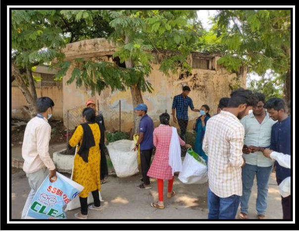
VOLUNTEERS CLEANING PLASTIC WASTAGE PREMISES OF BUS STAND