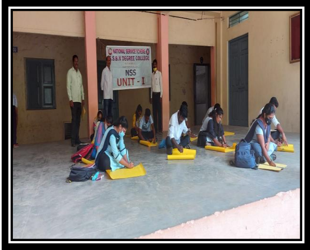
ESSAY WRITING, POSTER MAKING, QUIZ & ELOCUTION COMPETITIONS WERE CONDUCTED ON THE OCCASION OF WORLD AIDS DAY