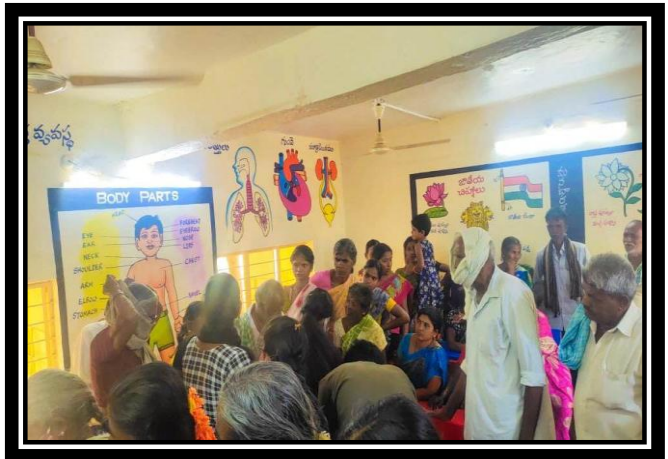
B.P. CHECKUP FOR THE VILLAGERS