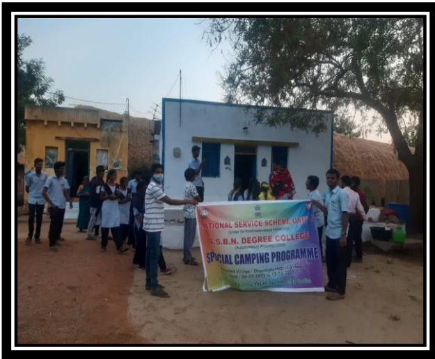
VOLUNTEERS INTERACTING WITH THE VILLAGERS