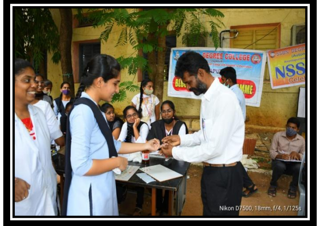
BLOOD GROUPING WAS CONDUCTED ON THE OCCASION OF NSS DAY