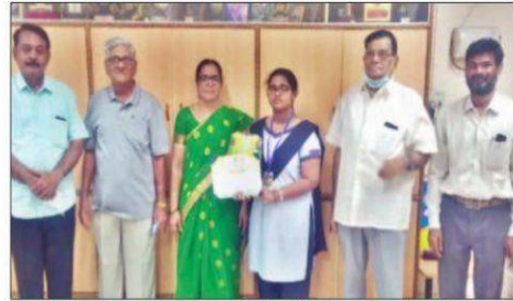
విద్యార్థిని అభినందిస్తున్న ఎస్ఎస్బిఎస్ విద్యార్థుల యాజమాన్యం