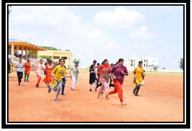
VOLUNTEERS PARTICIPATING IN SELECTIONS