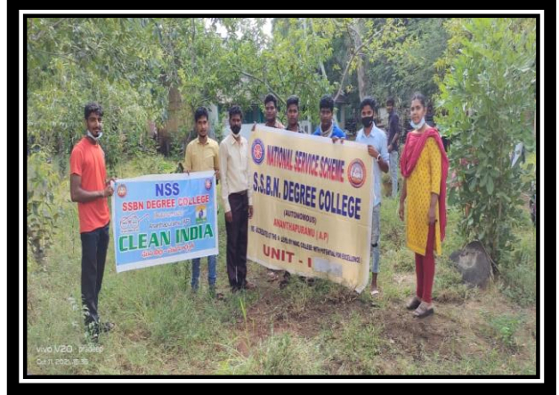
PROGRAMME OFFICER ALONG WITH VOLUNTEERS AFTER CLEANING THE PREMISES