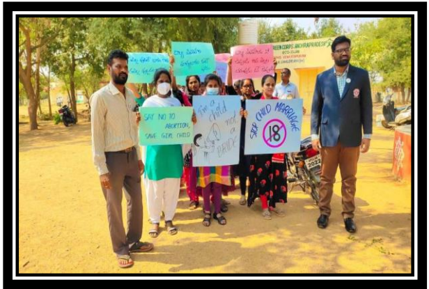
AWARENESS RALLY ON CHILD MARRIAGES AND FEMALE FOETICIDE IN DAYALLAKUNTA PALLI VILLAGE.