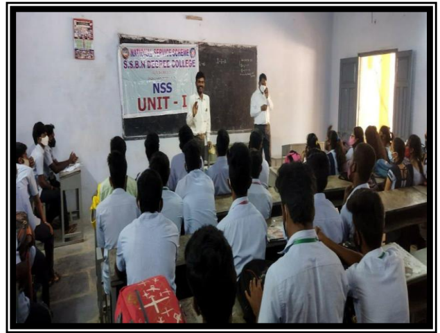
PRINCIPAL AND P.O. INTERACTING WITH THE STUDENTS TO ENROL AS A VOLUNTEER IN NSS